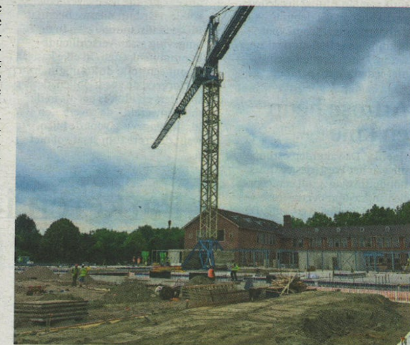
Fundering voor nieuwbouw bij Werenfridus.