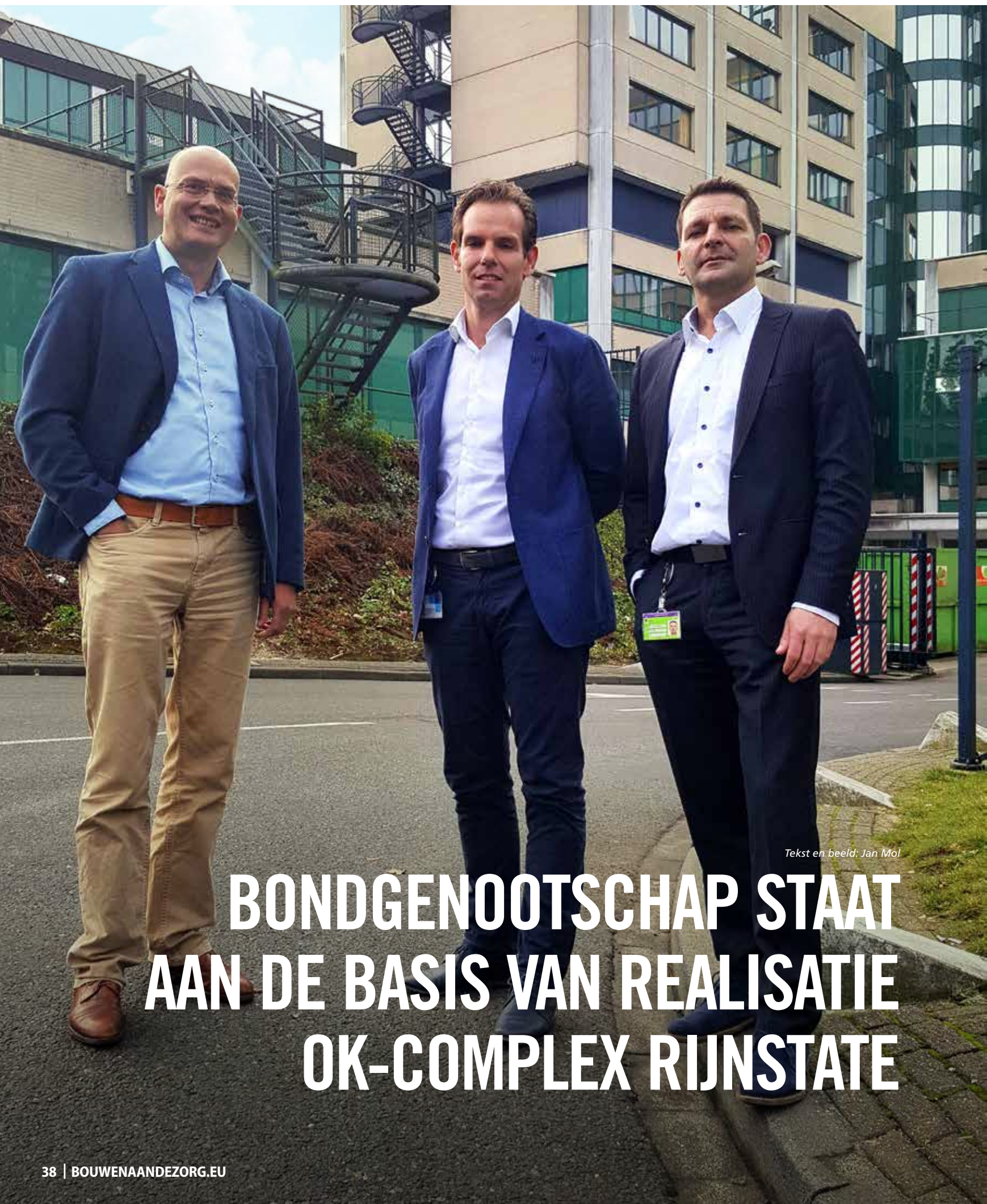
Tekst en beeld: Jan Mol